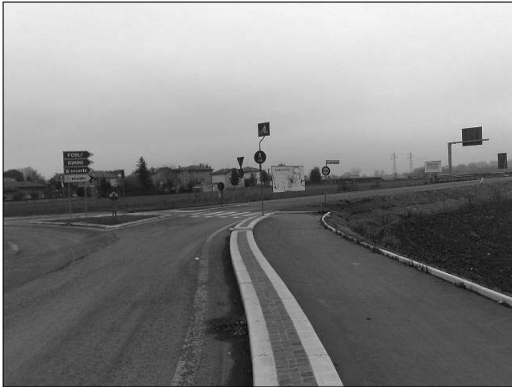
Via Leo Valiani loc. Ponte Pietra (Bretella Secante) - Vista a Via Leo Valiani

Cesena (FC) - Impianti bifacciali f.to 3x2h - Impianti N. Id. 1, 2, 3, 4: "Spazio libero"