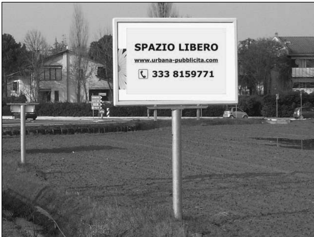
Via Leo Valiani loc. Ponte Pietra (Bretella Secante) - Impianto 4: "Spazio libero"