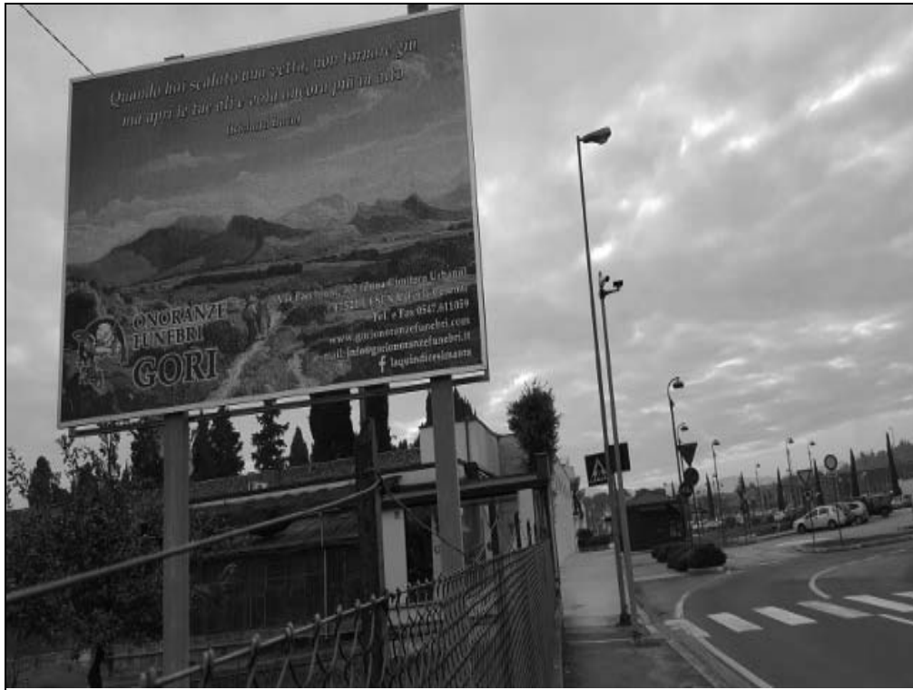
Via Pacchioni c/o civ. 319 - Impianto 5: Pubblicità "Onoranze Funebri Gori", vista ravvicinata

Cesena (FC) - Impianto monofacciale f.to 3x2h - Impianto N. Id. 5: "Onoranze Funebri Gori"