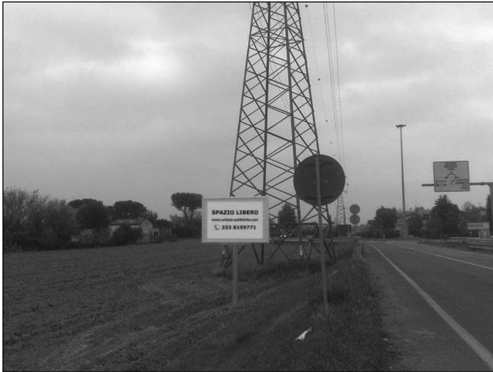
Via Leo Valiani loc. Ponte Pietra (Bretella Secante) - Impianto 2: "Spazio libero"