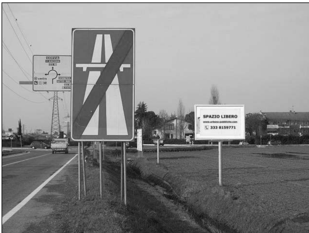
Via Leo Valiani loc. Ponte Pietra (Bretella Secante) - Impianto 4: "Spazio libero"