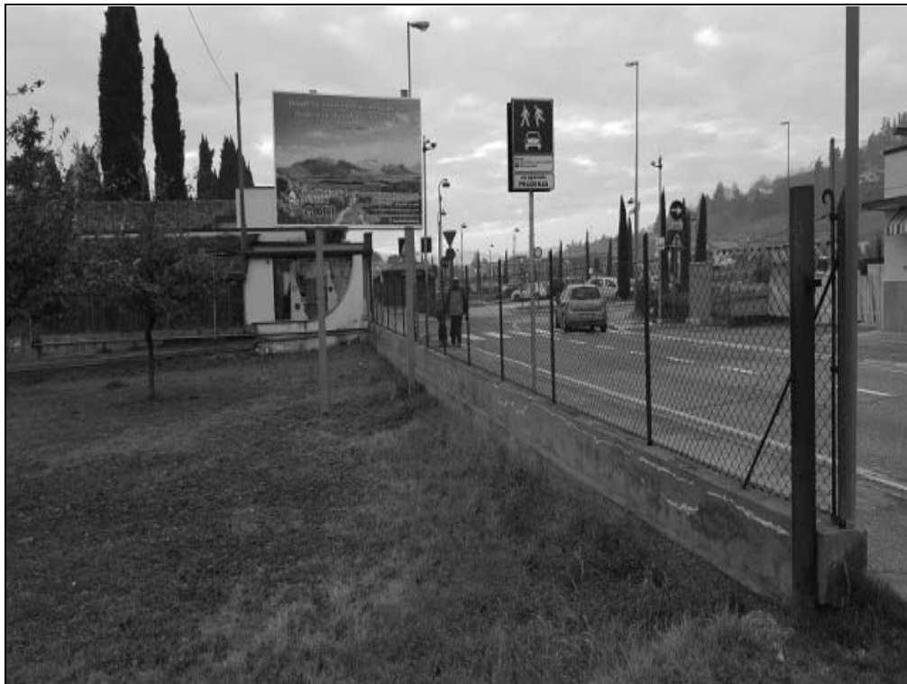
Via Pacchioni c/o civ. 319 - Impianto 5: Pubblicità "Onoranze Funebri Gori", vista ampia

URBANA di Castellucci Gianfranco - Via A. Lamarmora, 32 - Villa Verucchio - 47826 VERUCCHIO - RIMINI