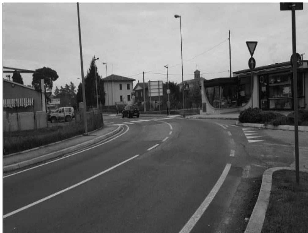
Via Pacchioni c/o civ. 319 - Impianto 6: "Spazio Libero"

URBANA di Castellucci Gianfranco - Via A. Lamarmora, 32 - Villa Verucchio - 47826 VERUCCHIO - RIMINI