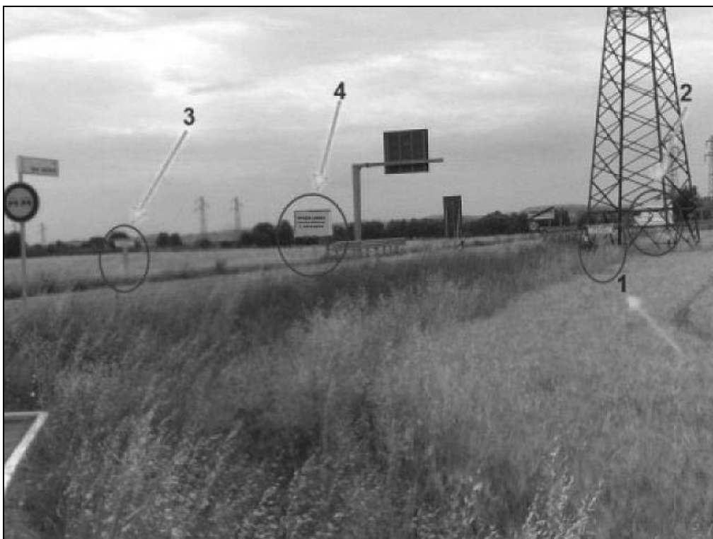
Via Leo Valiani loc. Ponte Pietra (Bretella Secante) - Foto panoramica degli impianti 1, 2, 3, 4

URBANA di Castellucci Gianfranco - Via A. Lamarmora, 32 - Villa Verucchio - 47826 VERUCCHIO - RIMINI