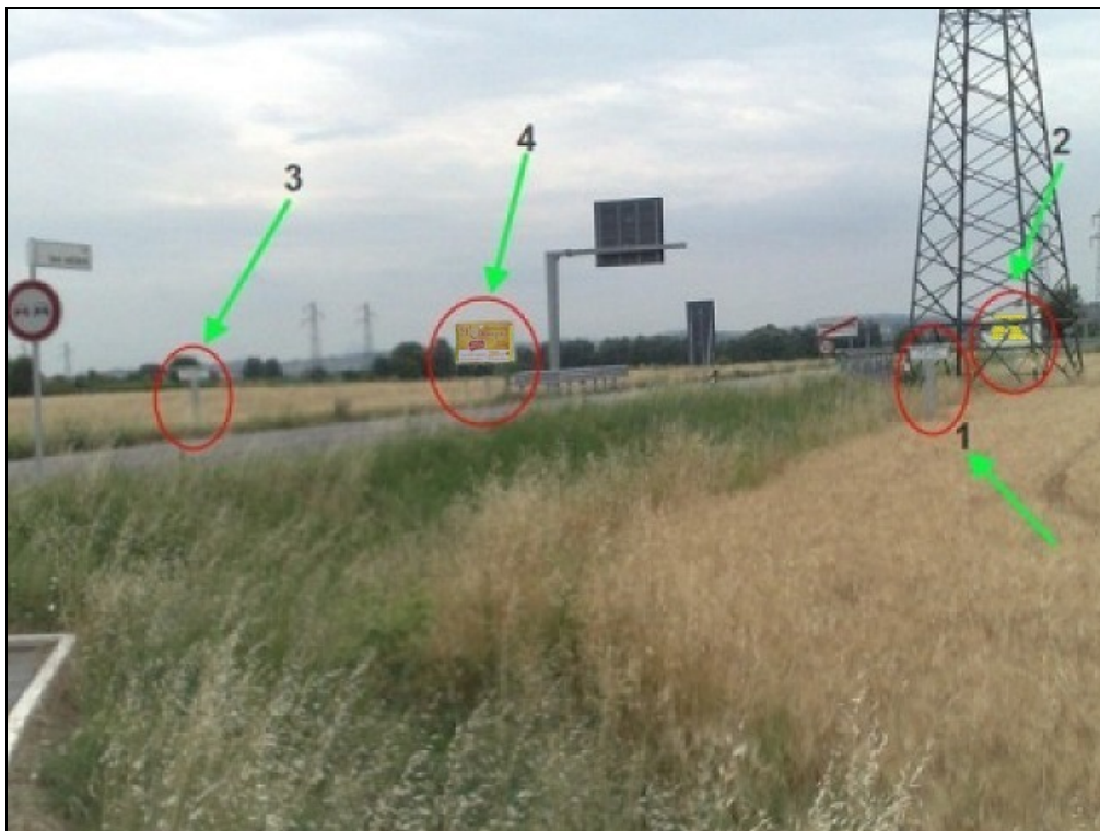
Via Leo Valiani loc. Ponte Pietra (Bretella Secante) - Foto panoramica degli impianti 1, 2, 3, 4