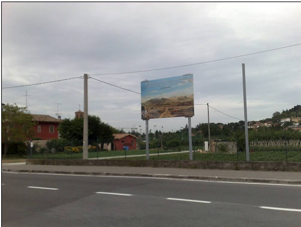
Via Pacchioni c/o civ. 319 - Impianto 5: Pubblicità "Onoranze Funebri Gori", vista ravvicinata