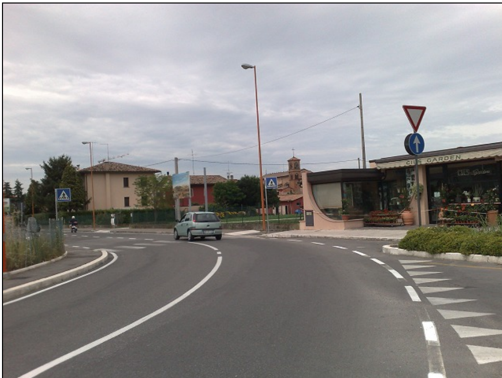
Via Pacchioni c/o civ. 319 - Impianto 5: Pubblicità "Onoranze Funebri Gori", vista ampia

URBANA S.r.l. - Via Consiglio dei Sessanta, 108 - 47891 DOGANA - REP. SAN MARINO