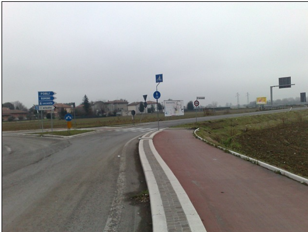
Via Leo Valiani loc. Ponte Pietra (Bretella Secante) - Foto panoramica degli impianti - Vista da Via Cesenatico