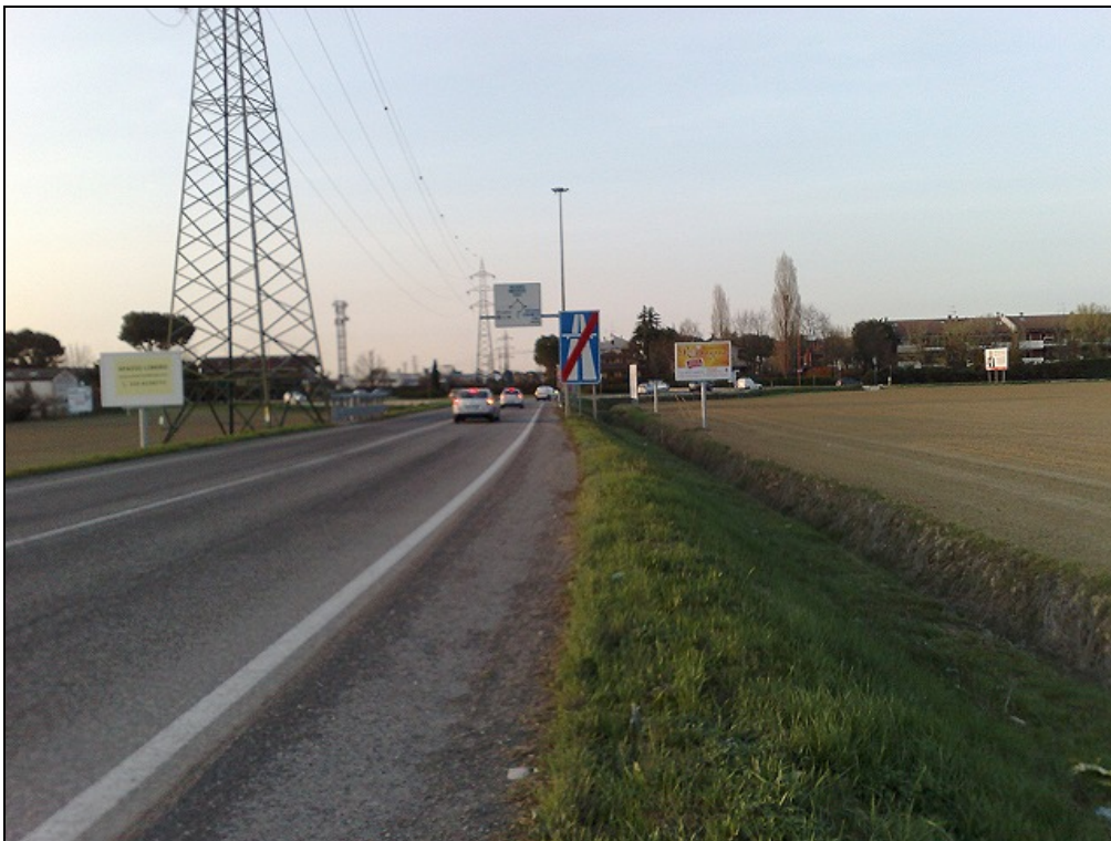
Via Leo Valiani loc. Ponte Pietra (Bretella Secante) - Foto panoramica degli impianti - Vista verso Via Cesenatico