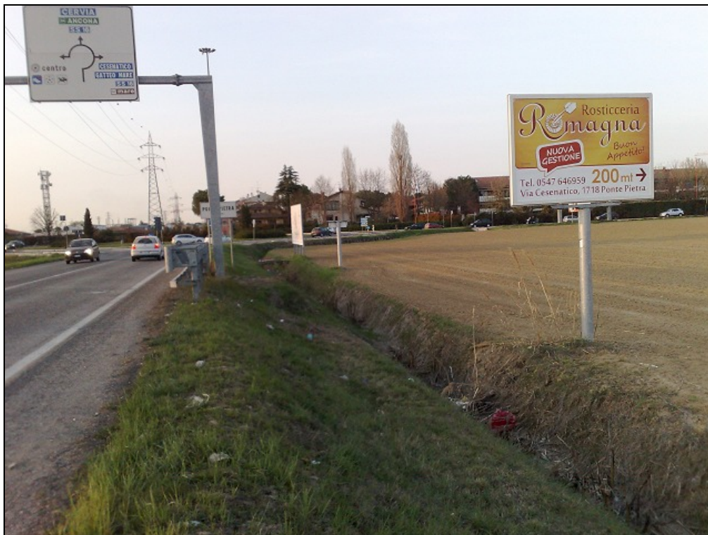
Via Leo Valiani loc. Ponte Pietra (Bretella Secante) - Impianto 4: "Rosticceria Romagna"