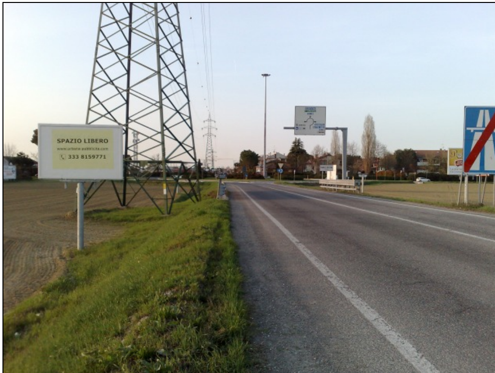
Via Leo Valiani loc. Ponte Pietra (Bretella Secante) - Impianto 2: "Spazio libero"